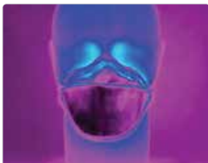
Einatmung: Aura™ 9320+Gen3 ohne Ventil