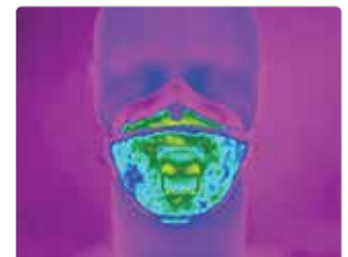
Ausatmung: Aura™ 9322+Gen3 mit Ventil

Das Einatmen ist der kühlere Teil im Atmungskreislauf; ob mit oder ohne Ventil - das leistungsstarke 3M™ Filtermaterial ermöglicht leichtes Einatmen durch die Atemschutzmaske von kühler Außenluft. Wenn der Maskenträger einatmet, wird die Luft durch die Maske gezogen und die Oberflächentemperatur der Maske sinkt.