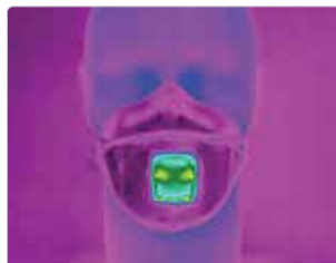
Einatmung: Aura™ 9322+Gen3 mit Ventil